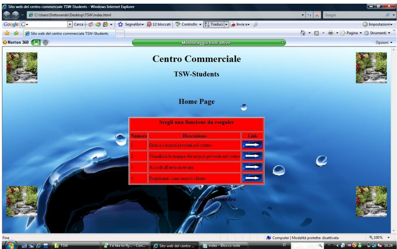
Figura 1: Home Page del sito web

Riprendiamo poi la home page del nostro sito.